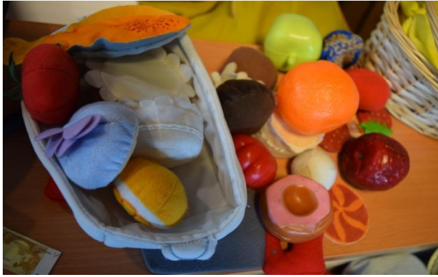
7. Fotoğraf: Kırmızı Zora. Avusturya, 2019