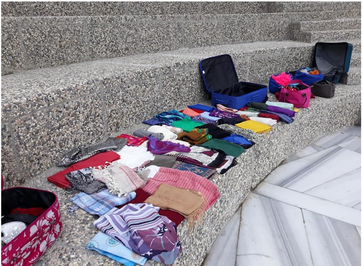
2. Fotoğraf: Hier kommt keiner durch. İstanbul, 2019