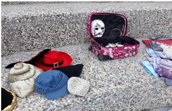
9. Fotoğraf: Hier kommt keiner durch. İstanbul, 2019