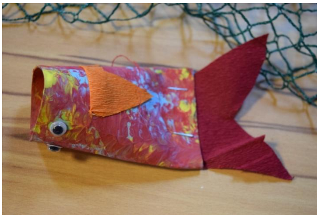
6. Fotoğraf: Kırmızı Zora. Avusturya, 2019