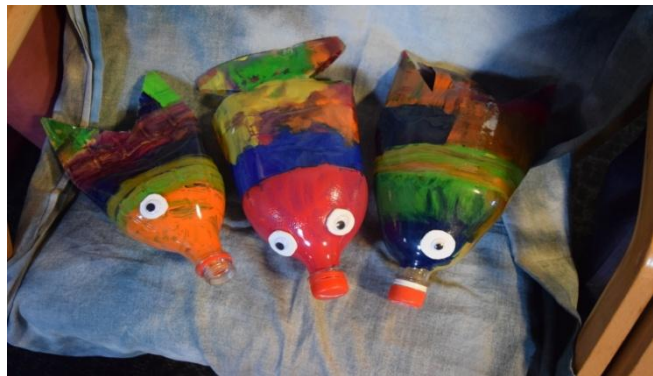
8. Fotoğraf: Kırmızı Zora. Avusturya, 2019