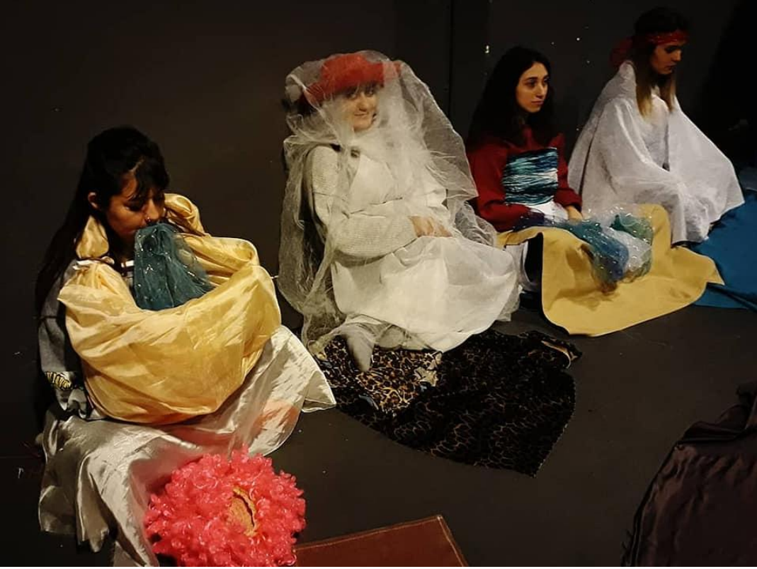
11. Fotoğraf: Baden Württemberg Kaplıcaları. İstanbul, 2020