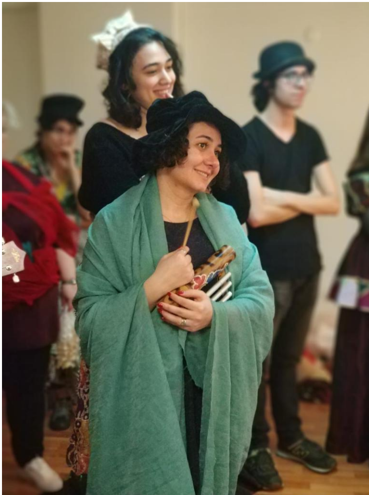
14. Lusitania. İstanbul, 2019