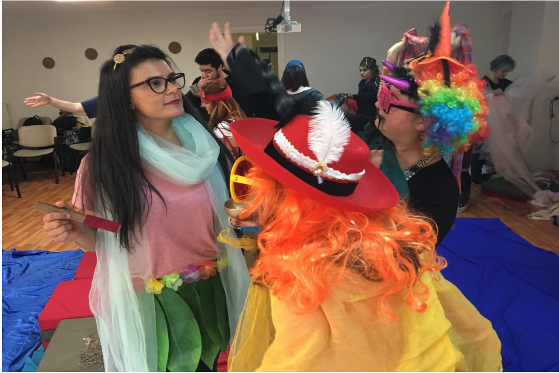
13. Lusitania. İstanbul, 2019