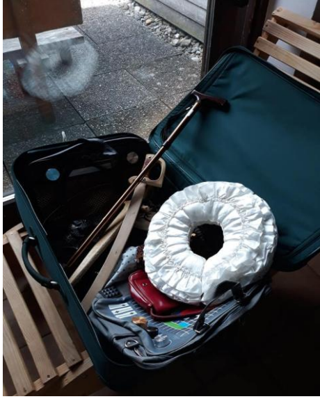
4. Fotoğraf: Kırmızı Zora. Avusturya, 2019