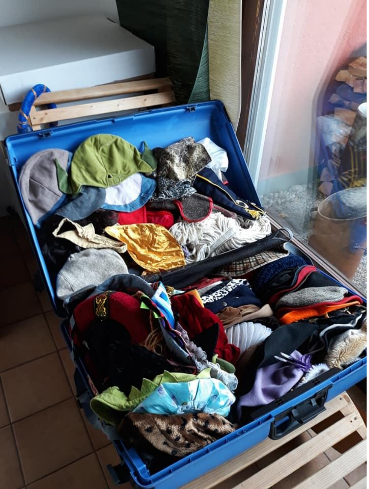
3. Fotoğraf: Kırmızı Zora. Avusturya, 2019