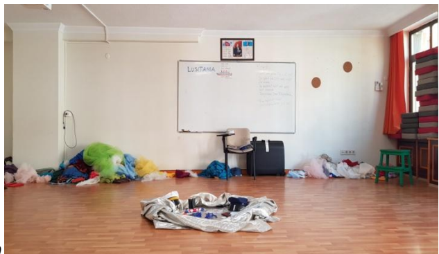
10. Fotoğraf: Lusitania. İstanbul, 2019