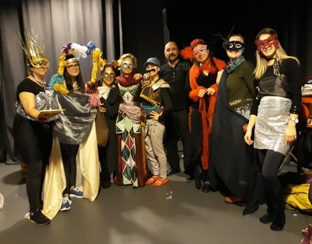
12. Fotoğraf: Casino Baden Baden. İstanbul, 2020