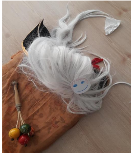
5. Fotoğraf: Uzak, Ankara, 2019